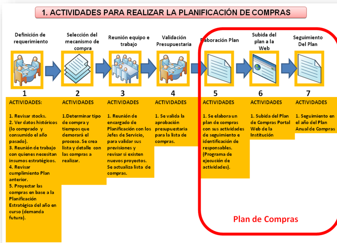
Ilustración 1 - Actividades para realizar la planificación de compras

Finalmente, la tercera fase es la preparación del PAC y el reporte. Se procede a la consolidación, información y preparación del PAC