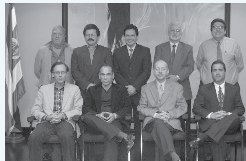
Junta Directiva, Caja Costarricense de Seguro Social

El cual establece la obligación de desarrollar las acciones necesarias para garantizar la calidad de atención y la seguridad del paciente.