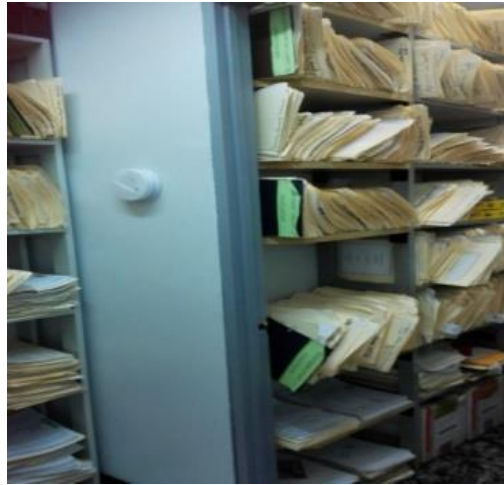
Imagen No. 8 Bodega de Cobros