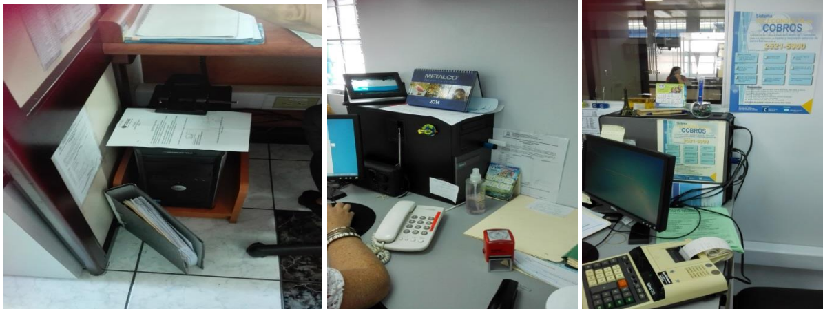
Imagen No. 9 Acumulación de papel cerca de las computadoras