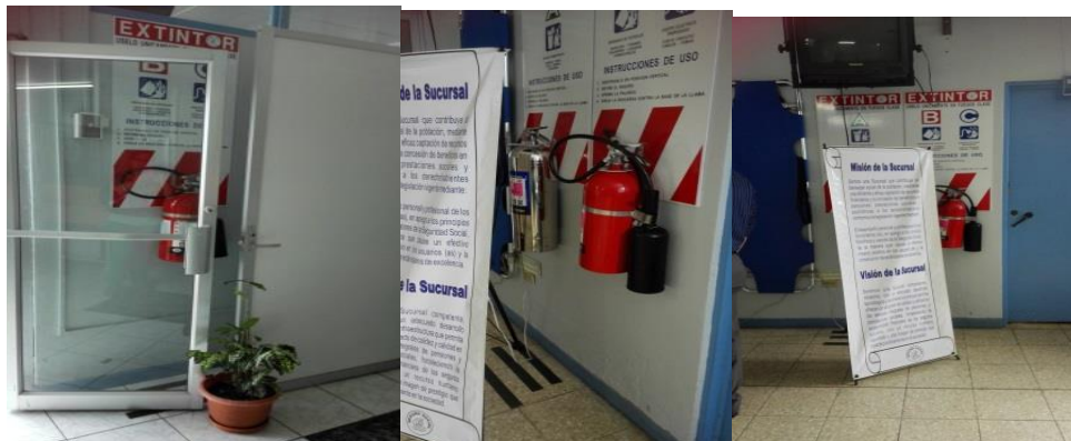
Imagen No. 7 Recorrido en Sucursal de Ciudad Quesada