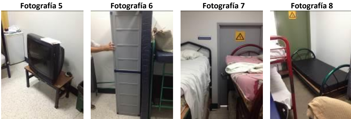
Fuente: Acta recorrido en las instalaciones del Hospital San Vicente de Paúl, del 20 de octubre del 2015.

No obstante, se observó que los Médicos Internos introdujeron artículos electrodomésticos y mobiliarios que obstaculizan los accesos de entrada de los cuartos de “Telecomunicaciones” tal y como se detalla en las fotografías de la 5 a la 7: