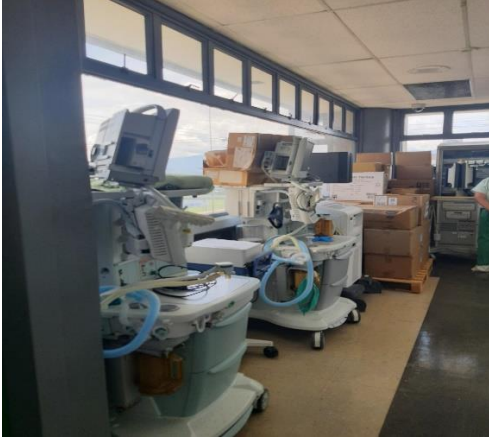
Máquinas de anestesia