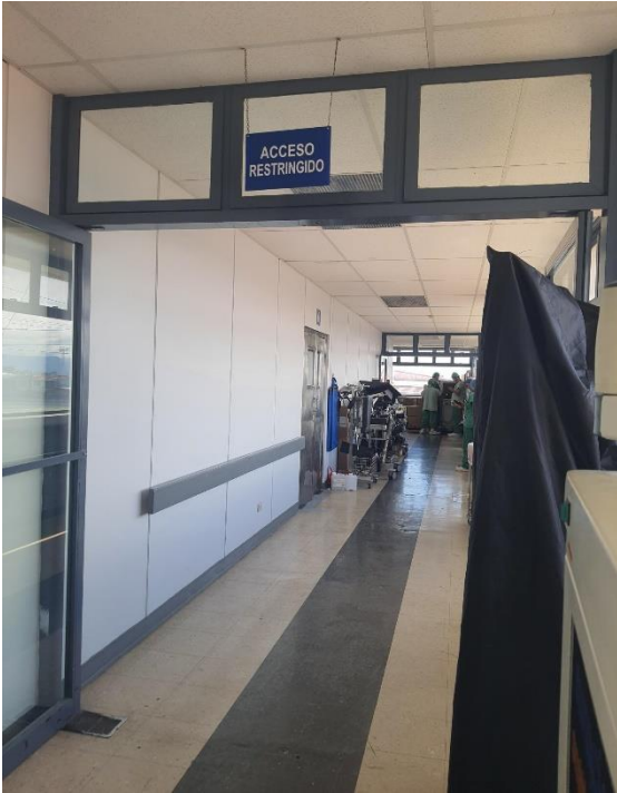
Inicio de la prueba