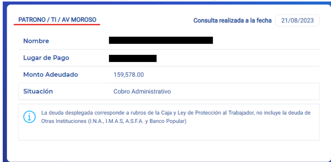
Imagen 2 Visualización de la consulta en Sitio web