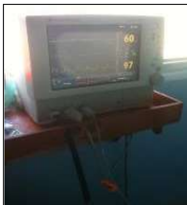
Batería no funciona