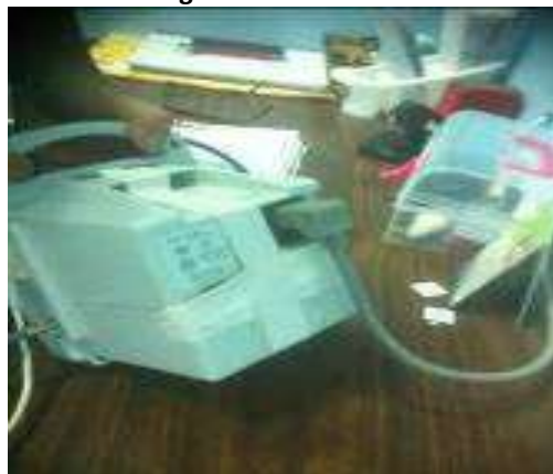
Monitor de signos vitales unido con esparadrapo.