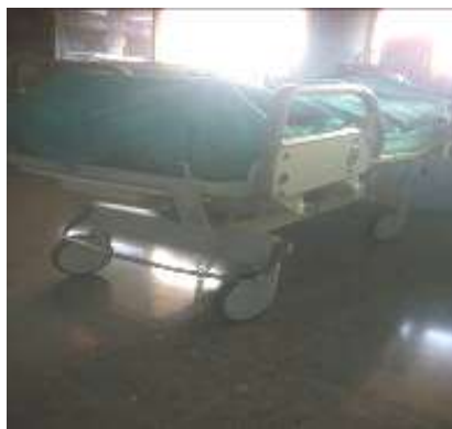
Batería no funciona