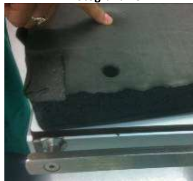
UTILIZACIÓN DE ESPARADRAPO EN COLCHON DE MESA QUIRÚRGICA

Las braceras de las mesas quirúrgicas se encuentran rotas y se utiliza esparadrapo para unir las partes. (Fotografías 29 a 31).