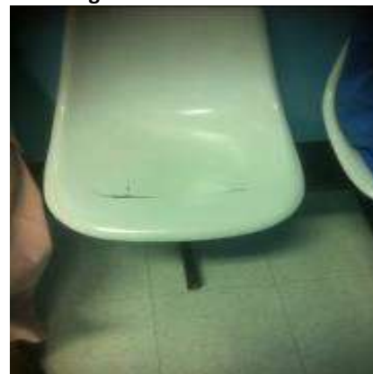
Banca con daños

El Monitor de signos vitales (activo 924763), fue reparado con esparadrapo para que no se desprenda la parte posterior (Fotografías 4 y 5).