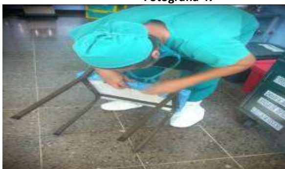
Activo 403679, reparada por lo funcionarios