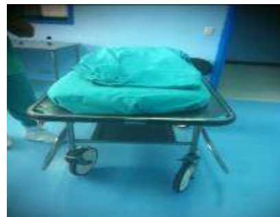
Camilla antigua, plana, sin posiciones

El mobiliario de esta Área se encuentra deteriorado: El activo 403679, silla ergonómica: en el sistema contable de Bienes Muebles se establece retirada, sin embargo, se encuentra en uso en recuperación. Los funcionarios del servicio la forraron con esparadrado y otro tipo de plástico para utilizarla. (Fotografía 47 y 48).