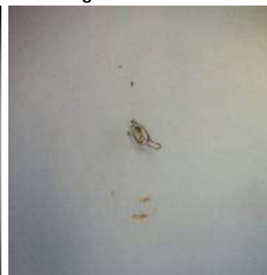
Oxido en bisagras de puertas, cableado expuesto en Sala 02.

Equipo Médico y Mobiliario: Las mesas donde se instalan los equipos evidencian herrumbre (fotografías 15- 16).