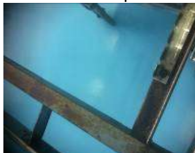
Exceso de herrumbre