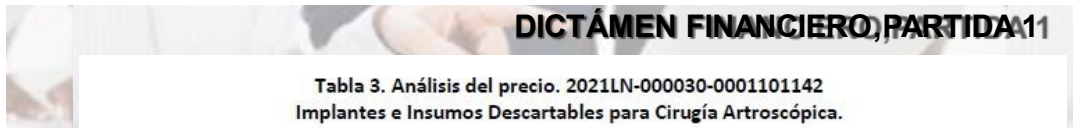
Tabla 3. Análisis del precio. 2021LN-000030-0001101142 Implantes e Insumos Descartables para Cirugía Artroscópica.